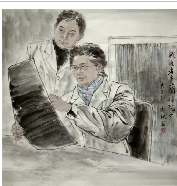
战“疫”者李兰娟院士(小学教育学院 季枫)

你有优秀传统锻造的基因 你有五千年历史凝成的顽强 2020年春天如果注定要成为战场 那就尽情战斗吧 因为春天已编好了花环 在前方等着你 等着你在前方,勇敢绽放