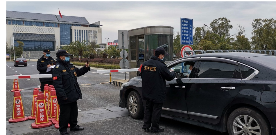
校园实行封闭管理,严格管控人员进出

学校高度重视疫情期间出现的典型事迹的教育意义,结合疫情防控工作在学生中开展爱国主义教育和道德教育,强化学生担当意识,引导学生培育和践行社会主义核心价值观。学校充分利用互联网平台开展网络思想政治教育,组织学生开展“吉职青年担使命,众志成城抗疫情”系列活动、“防控疫情从我做起”主题班会、观影明志、悦读经典、录制视频助力抗疫、“众志成城同心抗疫”三行情书、“众志成城、同心抗疫”主题书画作品征集、“疫”主题征文活动、“众志成城抗击疫情”原创作品等活动,教育引导广大学生正确认识疫情,承担防疫责任,履行防疫义务,共同打赢疫情防控阻击战。