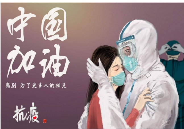
中国加油(吉安市示范性综合实践基地 匡正)

习总书记说:“武汉胜则湖北胜,湖北胜则全国胜。”虽然,抗击新冠疫情的完全胜利暂时还没有到来,但在全国国人的努力下,胜利的曙光一定离我们不会太远!我相信,胜利最终一定会属于党和广大人民!