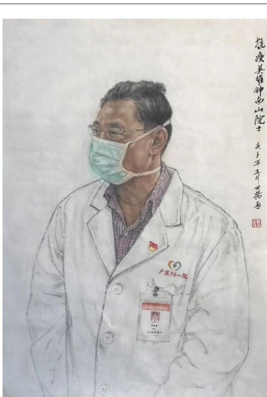
忠诚的卫士(美术馆 肖世扬)