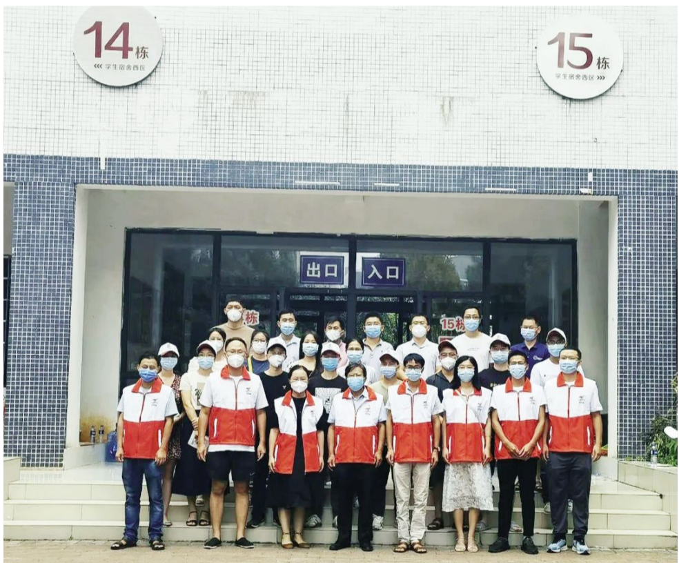
机电学院党总支吉先锋