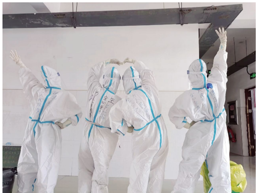
学生志愿者在楼栋服务

守护家园,积极弘扬伟大抗疫精神,坚决打赢疫情防控攻坚战,用实际行动诠释着吉职青年的力量与担当,他们用自己温暖的身影,汇聚成一幕幕感人的瞬间。