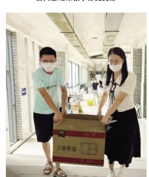
公共基础课教学部党支部同志送餐至学生宿舍