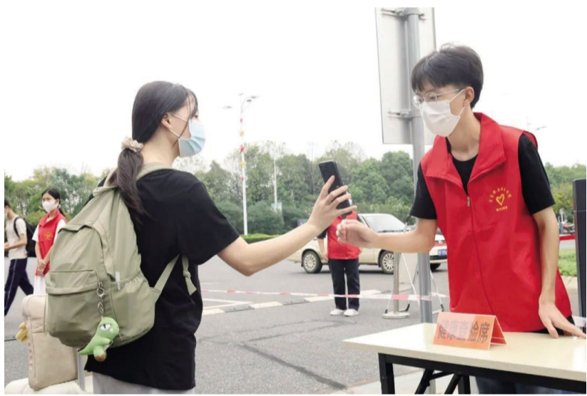
志愿者在查验返校学生的健康码、行程卡和核酸检测结果

(团委 廖萍) 自9月2日学校实行校园静态管理以来,为全面贯彻落实校党委行政的决策部署,履行好组织全校学生志愿者的工作职责,校团委积极响应,在校党委组织部领导下,组织动员全校青年、团学骨干积极参与志愿服务,在抗疫一线凝聚最美“志愿红”。他们用青春的底色绘就了动人的抗疫图