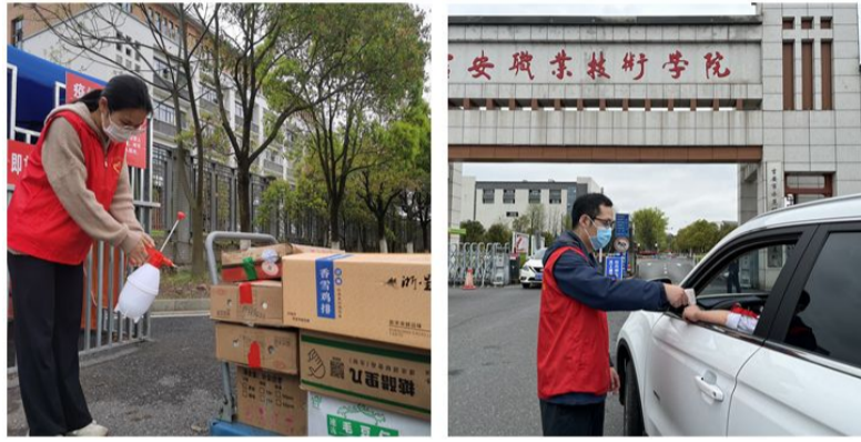
全校师生党员坚守在疫情防控一线

何种地位、何种身份,都主动配合。这种‘听从指挥、服务大局’的意识,这种自发形成的‘命运共同体’,坚定了人民群众战胜疫情的信心。”