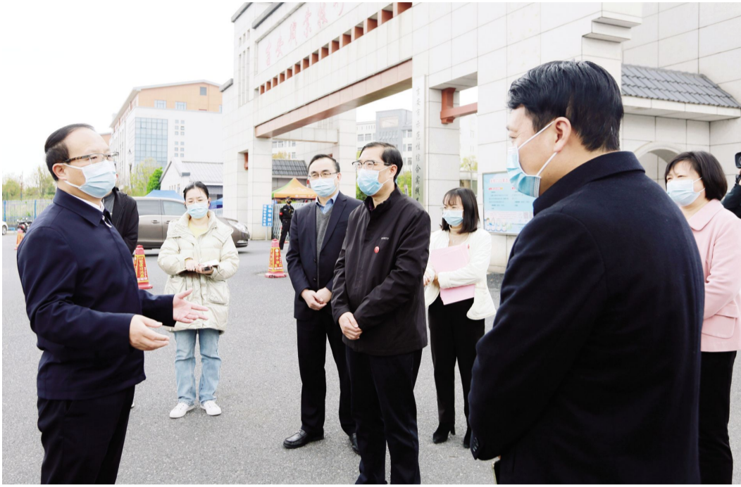
市委书记王少玄调研指导

王少玄认真询问校园出入管理、健康监测、核酸检测、防疫物资储备、志愿服务队建设等各项疫情防控工作的落实情况,并分析了当前疫情防控工作的严峻态势,对下一步疫情防控工作作出了针对性指导。他强调,要始终把师生的生命安全放在首位,严格管控校门,筑牢校园疫情防控安全屏障,落实好进校人员“一测一戴三查”制度;要健全反应迅速、运转高效、执行有