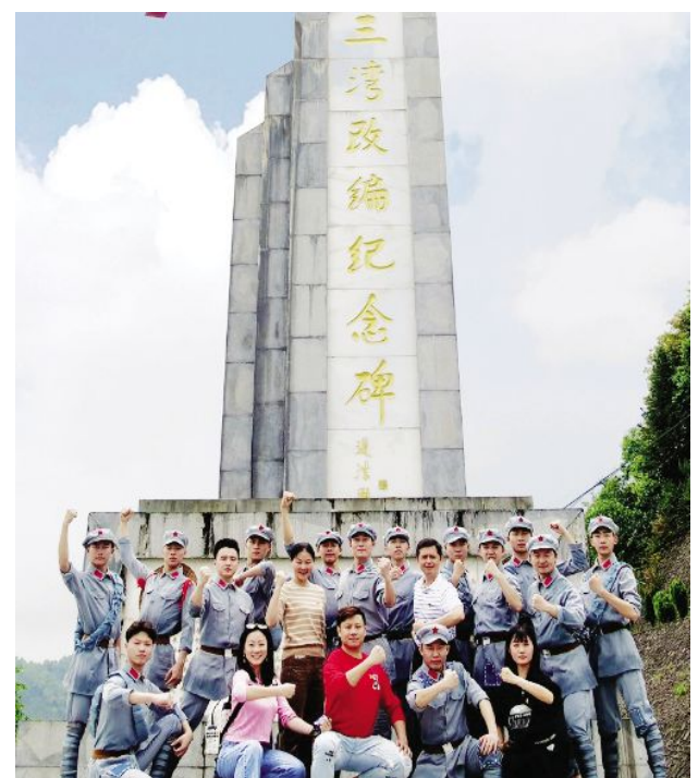
吉安文艺学校师生拍摄现场

学校此次作品入选,既是对学校办学水平、专业实力的充分肯定,同时也是学校初心不忘、忠诚党的见证。今后,学校将继续围绕立德树人根本任务,充分依托井冈山革命根据地丰富的红色资源优势,以高质量的红色剧目创作去传承致敬井冈山精神。