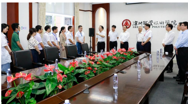
党政代表团看望在深职院进修学习的师生