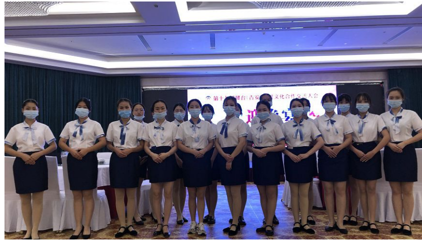
参与接待服务的同学集体形象展示