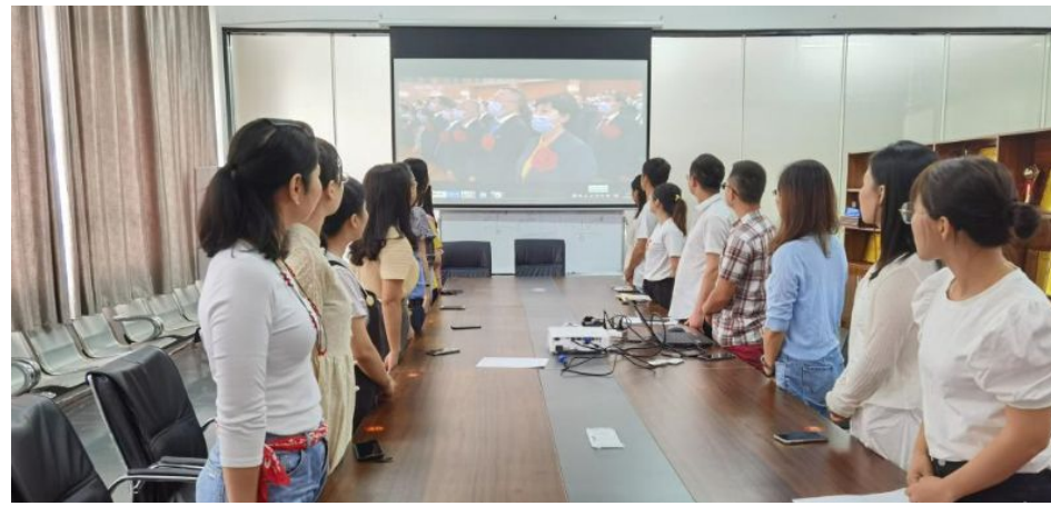
经管学院教师集中观看表彰大会直播

切感受到中国共产党始终坚持‘人民至上’的执政理念,始终把人民群众生命安全放在第一位。作为一名思政教育工作者,我将把此次抗击新冠肺炎疫情当中涌现出来的先进人物事迹和精神纳入到学生的思政教育当中,把爱国主义教育、生命教育、责任教育融入进给学生的开学第一课,将其作为生动的思政教育教材。” 护理专业的同学表示:“我不禁热泪盈眶,让我深刻感受到中华民族的伟大,感受到各民族一家亲,一方有难、八方支援。作为医学院20级新生,我很荣幸加入医学生的队伍中,我要传承医前辈们舍己为人、无私奉献的精神,更要静下心来想一想自己的人生规划,树立正确的人生观、价值观,为我们的祖国的医疗行业贡献一份自己的力量。” 通过观看此次大会,我校师生深入学习了习近平总书记重要讲话精神,广大师生纷纷表示要提高思想认识、提升政治站位,坚持