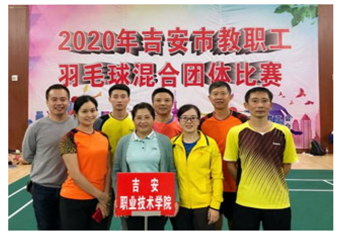
参加比赛教师合影留念

本报讯(工会 邓宝玲)9月27日,吉安市教育工会举办的全市教育系统教职工羽毛球混合团体比赛在吉安市体育中心羽毛球馆拉开了帷幕。分别来自县市区和市直教育单位共二十四代表队参加了比赛。团体赛设立男子单打、女子单打、男女混合双打、男子双打和女子双打五个项目,经过一天的激烈比拼,我校选派的9名老师通过团结合作、默契配合、紧咬比分、发扬拼搏不言弃的精神,最终获得了团体第二名的好成绩。