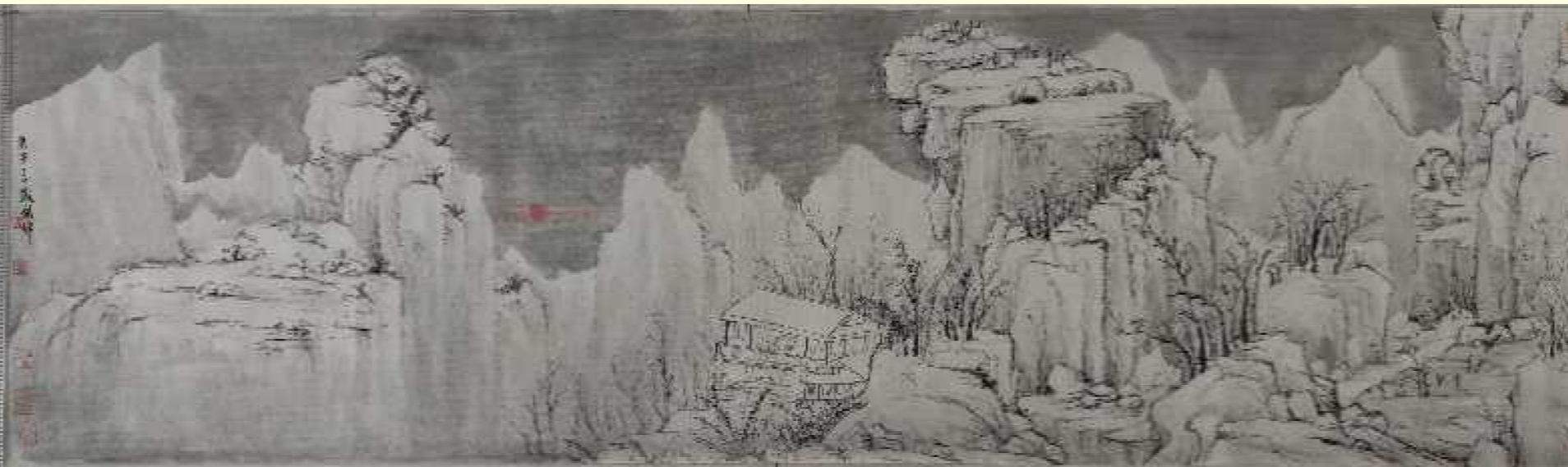
小学教育学院 16小教五(10)班 胡玮