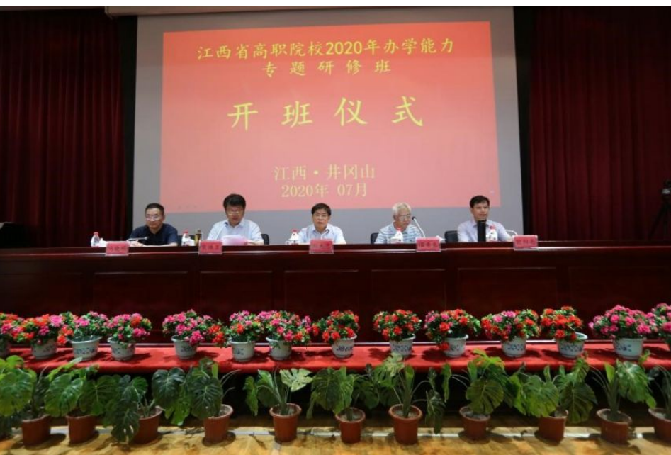
江西省高职院校2020年办学能力专题研修班开班仪式

郭杰忠指出,研修班的举办是为了让全省职业院校进一步认清形势,找准差距,确立标杆,争创一流。我们要清醒认识我省高职教育面临的形势,要牢牢把握高职教育发展的良好机遇,要切实推进高职教育改革发展重点工作任务。职业教育“前途广阔,大有作为”,新时代需要大国工匠,更需要职业教育。近年来,江西的职业教育取得了一些成效,但还是有很多不足,有很大的进步空间。要进一